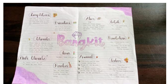
Gambar 2 Hasil Kerja Siswa

(c) Kembangkan menjadi beberapa kalimat dengan menerapkan struktur dan unsur-unsur