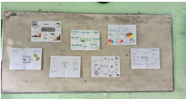
Gambar 3 Hasil Penulisan Peta Konsep

pembangunnya seperti tema, tokoh, penokohan, setting , amanat. Setelah peta konsep berupa rancangan novelet selesai kemudian dikembangkan menjadi kalimat utuh yang nantinya membentuk suatu cerita lengkap sesuai dengan struktur dalam penulisan novelet. Kemudian hasil kerja peserta didik dipresentasikan di depan kelas dan diambil dokumentasinya berupa foto serta video ketika siswa mempresentasikan rancangan noveletnya yang masih berupa peta konsep yang sudah dikembangkan menjadi beberapa kalimat pembentuk unsur-unsur novelet. Dalam kegiatan ini penulis membagi empat sesi dalam kegiatan mempresentasikan rancangan peta konsep peserta didik. Dalam setiap sesi semua hasil kerja berupa peta konsep tersebut ditempelkan di papan tulis agar proses kegiatan lebih menarik dan menyenangkan. Dengan begitu peserta didik memiliki motivasi yang tinggi untuk menunjukkan penampilan terbaiknya di hadapan para peserta didik yang lain. Seperti tampak pada gambar berikut.