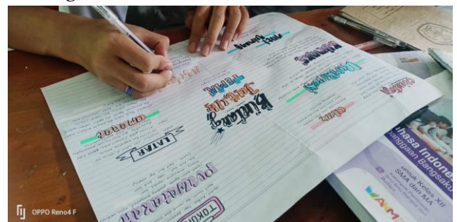
Gambar 1 Membuat Peta Konsep Novelet

Bentuk pemberian tugas berupa merancang dan menulis novelet menggunakan teknik "CABUK BULAN" melalui langkah-langkah berikut (a) Cari inspirasi/kreativitas . Pada langkah awal ini peserta didik diajak mencari ide dan berimajinasi. Ide yang dicari bisa berasal dari pengalaman dirinya sendiri ataupun orang lain bahkan bisa juga dari fenomena-fenomena atau realita yang terjadi di lingkungan sekitar peserta didik. (b) Buat alur berbentuk peta konsep sesuai dengan jalan cerita. Setelah menemukan inspirasi langkah selanjutnya adalah membuat alur cerita dengan teknik peta konsep untuk merancang cerita mulai dari tokohnya, penokohnya, latar, amanat atau unsur intrinsik yang lainnya. Seperti yang terdapat dalam gambar berikut.