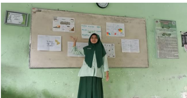
Gambar 4 Mempresentasikan Rancangan Novelet

(d) Bukukan menjadi kumpulan/antologi novelet. Langkah ini dilakukan pada pertemuan pembelajaran berikutnya setelah siswa mempresentasikan peta konsep yang dibuat kemudian dikembangkan menjadi teks utuh berupa cerita novelet baru kemudian dibukukan. Pada kegiatan ini peserta didik sudah mulai melakukan kegiatan menulis sebuah novelet berdasarkan rancangan yang berupa peta konsep yang telah dibuat oleh peserta didik. Tampak gambar berikut.